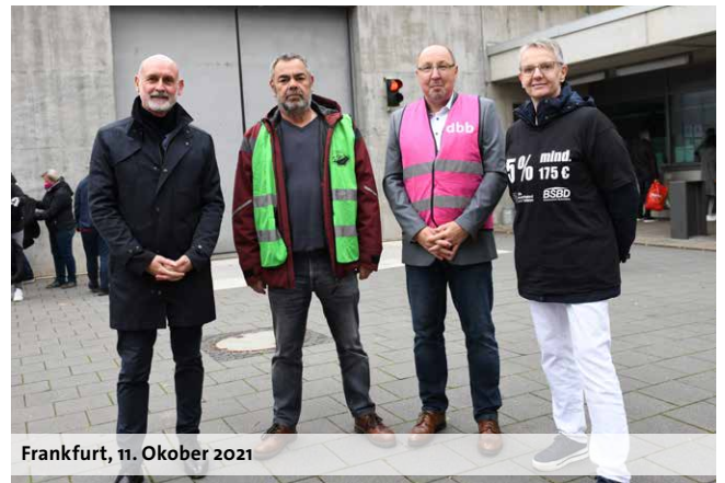
Frankfurt, 11. Oktober 2021