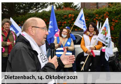
Dietzenbach, 14. Oktober 2021