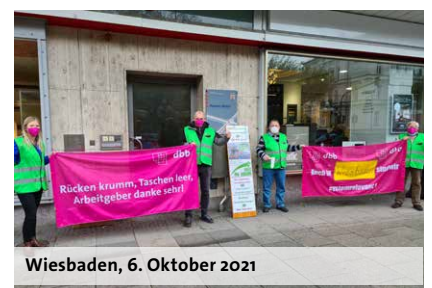
Wiesbaden, 6. Oktober 2021