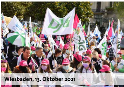
Wiesbaden, 13. Oktober 2021