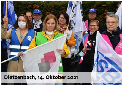
Dietzenbach, 14. Oktober 2021