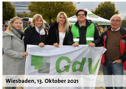
Wiesbaden, 13. Oktober 2021