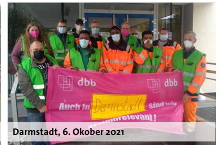
Darmstadt, 6. Oktober 2021

lich: „Natürlich sind das zwei Verhandlungen, die unabhängig voneinander zu sehen sind. Ich halte auch nichts davon, jetzt einzelne Ergebnisbestandteile von der TdL zu fordern. Was ich aber von der TdL fordere, ist, dass sie die Verhandlungskultur übernehmen, die die hessischen Verhandlungen geprägt hat. In Hessen haben die Tarifpartner abschlussorientiert verhandelt, haben auf Drohkulissen verzichtet und tatsächlich gemeinsam und erfolgreich den öffentlichen Dienst attraktiver gestaltet. Die TdL hat bisher nur die Keule des Arbeitsvorgangs geschwungen. Damit lässt sich der öffentliche Dienst jedoch nicht attraktiver gestalten.“