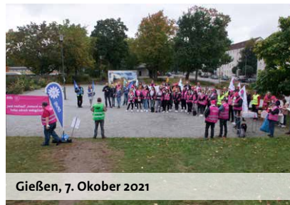
Gießen, 7. Oktober 2021