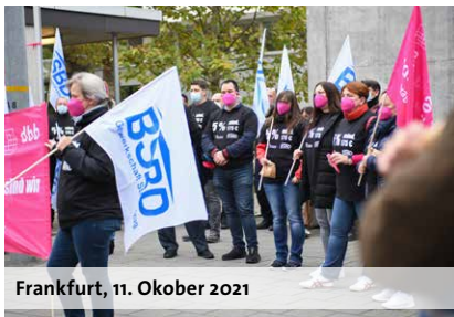
Frankfurt, 11. Oktober 2021