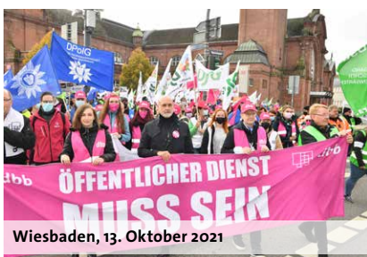
Wiesbaden, 13. Oktober 2021