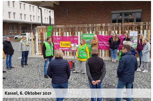
Kassel, 6. Oktober 2021

Die vollständige Tarifeinigung hat der dbb auf seinen Sonderseiten zur Einkommensrunde unter www.dbb.de/einkommensrunde ins Netz gestellt. Kurze Erläuterungen zu den Bestandteilen des Abschlusses geben wir in unserem Rundschreiben 13/2021.