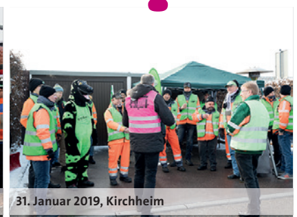
31. Januar 2019, Kirchheim