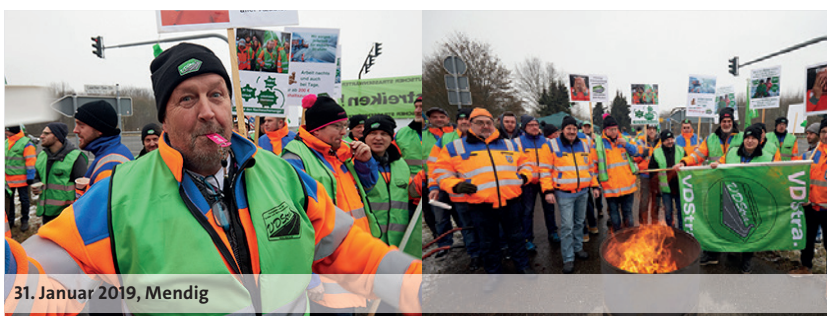
31. Januar 2019, Mendig