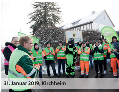
31. Januar 2019, Kirchheim