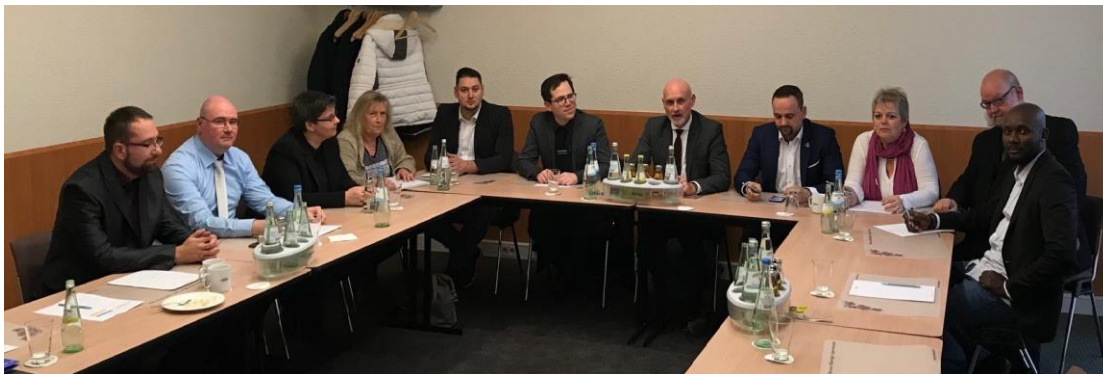
Verhandlungskommission des dbb

Die nächste Verhandlungsrunde findet am 7. Dezember 2018 in Frankfurt statt.