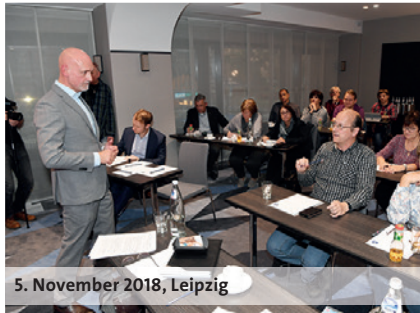
5. November 2018, Leipzig