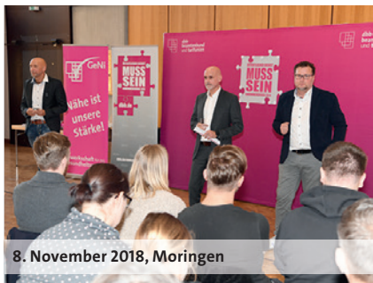
8. November 2018, Moringen