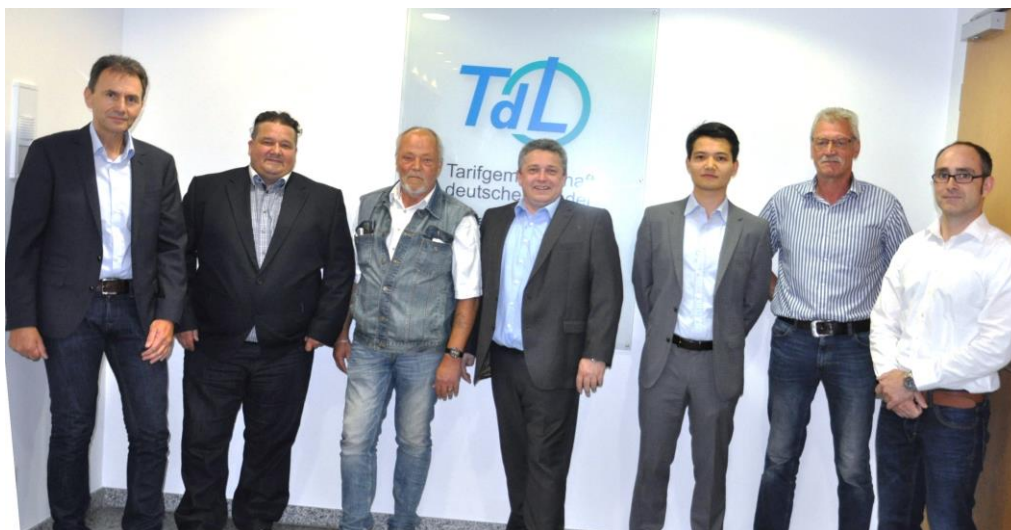
dbb Verhandlungskommission Kampfmittelräumdienst

Bis zu unserem nächsten Verhandlungstermin am 24. Oktober werden wir mit Mitgliedern unserer Verhandlungskommission ein aus unserer Sicht fachgemäßes Eingruppierungsschema mit den jeweiligen Tätigkeitsmerkmalen entwerfen. Für uns ist entscheidend, dass die Tätigkeit jedes Beschäftigten richtig erfasst und richtig entlohnt wird!