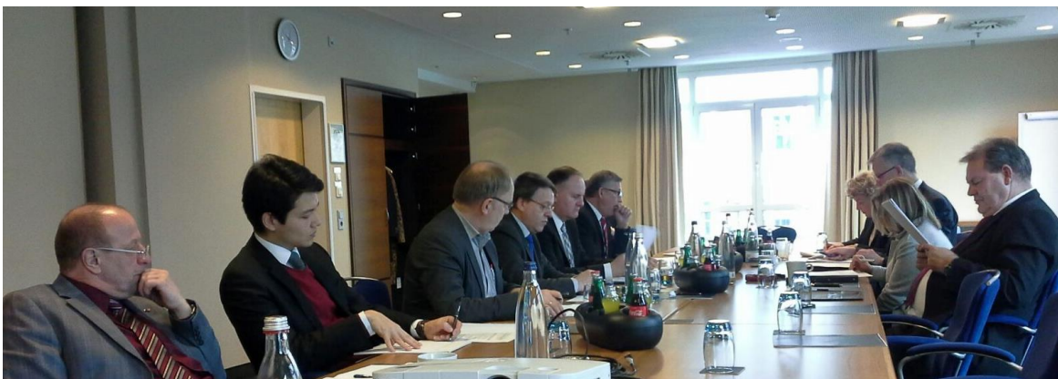
Verhandlungskommissionen mit Vertretern der BwFPS GmbH

Für jeden Betriebsrat sind jeweils neun Mandatsträger und zwei Freistellungen vorgesehen. Der Tarifvertrag tritt mit Unterzeichnung in Kraft, diese wird voraussichtlich noch im März vollzogen. Die nächsten Betriebsratswahlen finden einheitlich für alle Betriebsräte in der 21. Kalenderwoche 2018 statt.