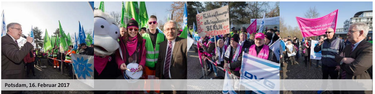
Potsdam, 16. Februar 2017

ausgesetzt. Die Tarifvertragsparteien werden nach Abschluss der Redaktionsverhandlungen zur Entgeltrunde die Gespräche zu strukturellen Fragen der Entgeltordnung fortsetzen.“ Die Antragsfristen bei Ansprüchen auf Höhergruppierung, Entgeltgruppenzulage und Angleichungszulage aus Anlass des Inkrafttretens der EGO-Lehrkräfte werden verlängert.