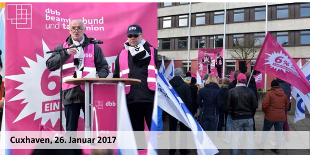
Cuxhaven, 26. Januar 2017