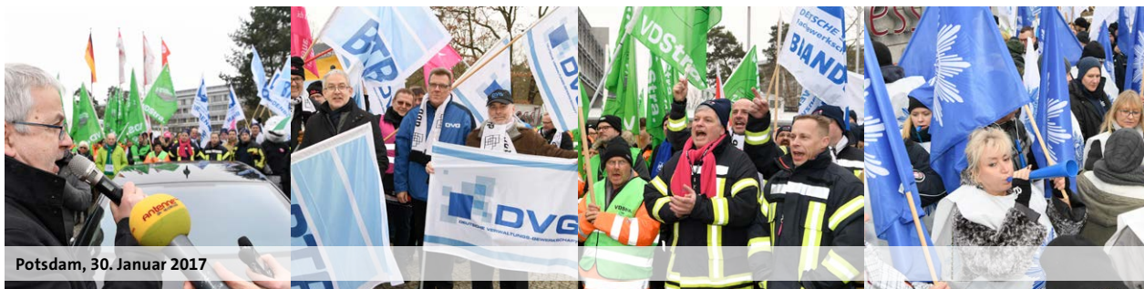
Potsdam, 30. Januar 2017

Das gilt vor allem für die Frage der Entgeltordnungen. Die allgemeine Entgeltordnung und die für die Lehrkräfte müssen fortentwickelt werden, und im Bereich des Sozial- und Erziehungsdienstes besteht ebenfalls Bedarf. „Deshalb“, so Russ weiter, „ist es unsere Idee, mit der Einführung der Stufe 6 eine Soforthilfe für viele Berufsgruppen zu leisten, um dann in nachgelagerten, aber fest vereinbarten Verhandlungen, die anstehende Eingruppierungsarbeit konkret anzugehen.“