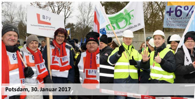
Potsdam, 30. Januar 2017