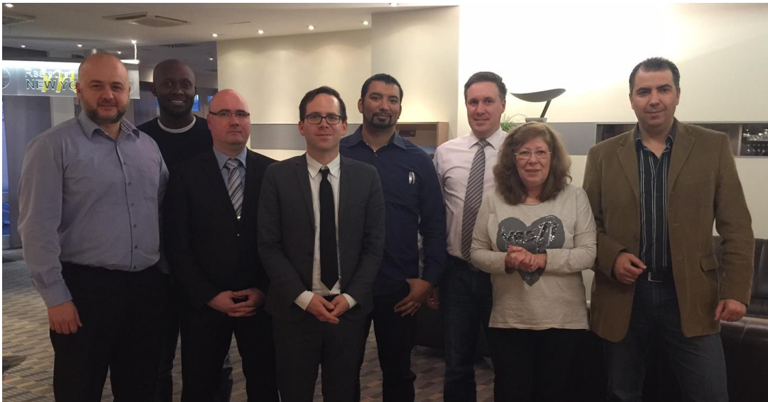
Verhandlungskommission des dbb

Wir erwarten zum nächsten Verhandlungstermin am 28. November 2016 ein Angebot, das den großen Einsatz und die gute Arbeit der Kolleginnen und Kollegen wertschätzt!