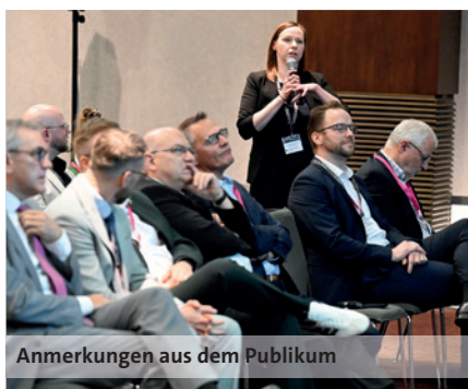
Anmerkungen aus dem Publikum