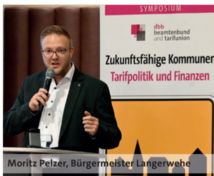
Moritz Pelzer, Bürgermeister Langerwehe