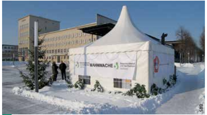
> Aktion „Mahnwache“ vor dem Sächsischen Landtag vom 29. November bis 3. Dezember 2010.

Ganze fünf Jahre später, am 17. November 2015, hat das Bundesverfassungsgericht beschlossen, dass die Alimentierung einer nach sächsischem Recht in A 10 besoldeten Kollegin im Jahr 2011 nicht verfassungsgemäß war. Das Grundgesetz (Art. 33 GG) verlangt aber eine amtsangemessene Alimentierung der Beamten. Mit diesem Beschluss wurde der Gesetzgeber zum Handeln gezwungen. Doch auch hier war zunächst völlig offen, inwieweit sich die sächsische Regierung „aus dem Fenster lehnt“: Rechnet man erneut mit spitzer Feder oder handelt die Staatsregierung im Sinne ihrer Beschäftigten und sorgt für eine Befriedung in diesem Punkt? Deshalb rief der SBB erneut dazu auf, den berechtigten Forderungen seiner beamteten Mitglieder Nachdruck zu verleihen. Im Rahmen einer Podiumsdiskussion kamen wir im Februar 2016 mit den Fraktionen des Sächsischen Landtages zur Thematik ins Gespräch. Und erneut wurden Tausende Briefe geschrieben und an Finanzminister Prof. Unland geschickt. Dieser hatte zwischenzeitlich die Vertreter der Gewerkschaften zum Gespräch geladen, um