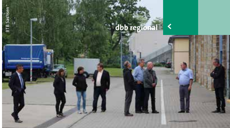
> Rundgang auf dem Gelände des THW-Ortsverbandes Dresden.

André Ficker gab einen Überblick zum Stand der Klageverfahren zur Senioritätsbezahlung und zur rückwirkenden Stufenfestsetzung. Er erläuterte dabei die Entscheidung des Bundesverfassungsgerichts vom 7. Oktober 2015, dass die Verfassungsbeschwerden