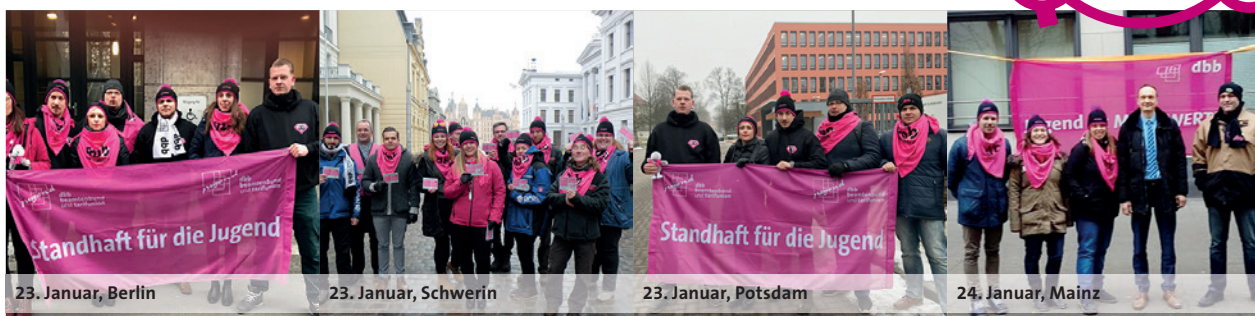
23. Januar, Berlin