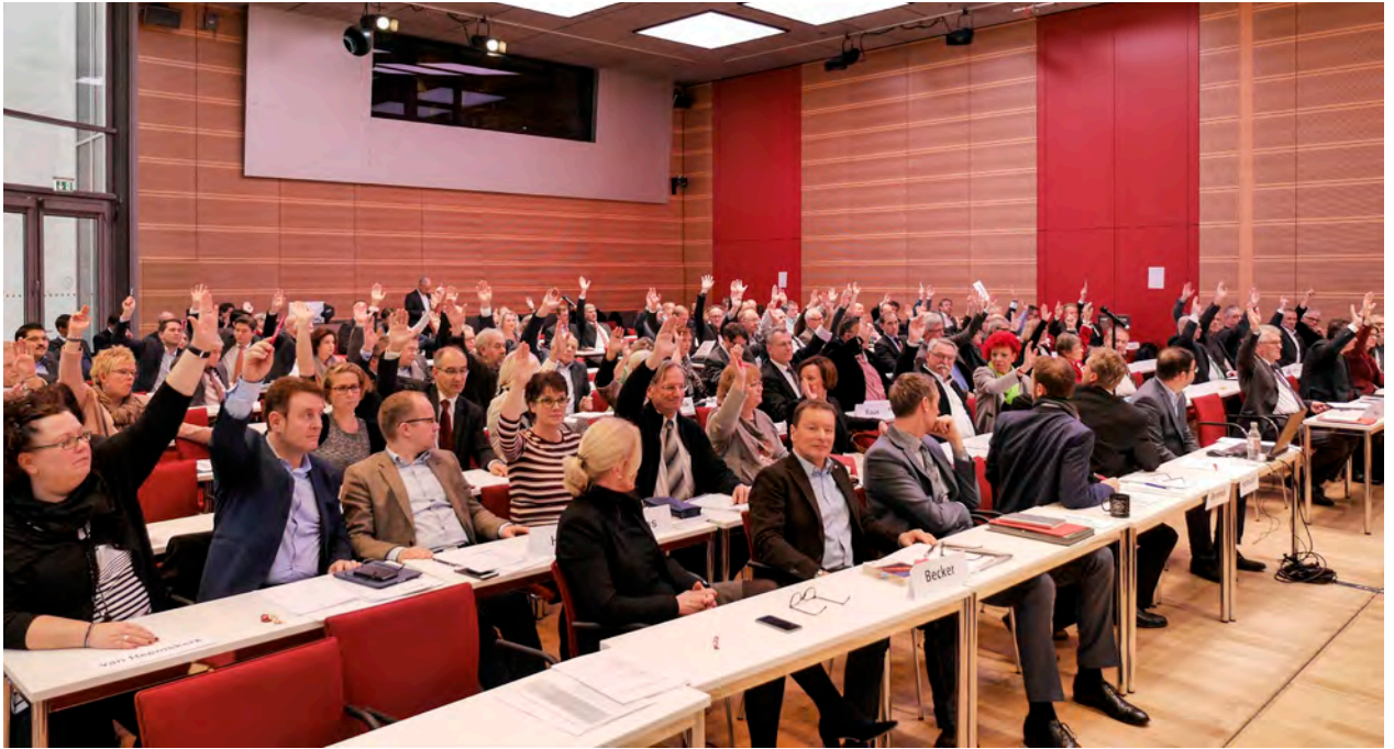
Abstimmung der dbb Gremien

Mehr Konkurrenz um qualifizierten und motivierten Nachwuchs wird es mit jedem neuen Ausbildungsjahr geben. Dieses Mehr an Herausforderungen ist nicht ohne ein Mehr an Perspektive, an Struktur und an Klarheit zu bewältigen. Dem tragen unsere Forderungen Rechnung: