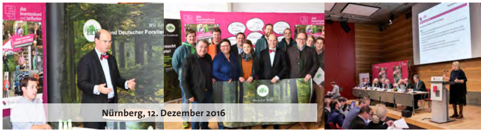
Nürnberg, 12. Dezember 2016