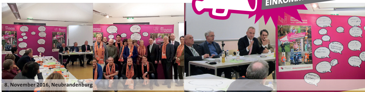
8. November 2016, Neubrandenburg