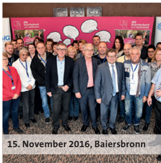
15. November 2016, Baiersbronn